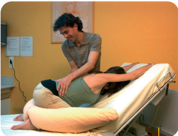
« 4 PATTES » AMÉNAGÉ

le coussin confort Physiomat ® est un accessoire précieux, d'utilisation simple. Il permet, sur une table classique, d'aménager des positions et de créer une mobilité permettant aux patientes de participer plus activement, d'être plus autonomes, avec ou sans péridurale. Ici présenté avec une galette et un ballon pour la mobilité.